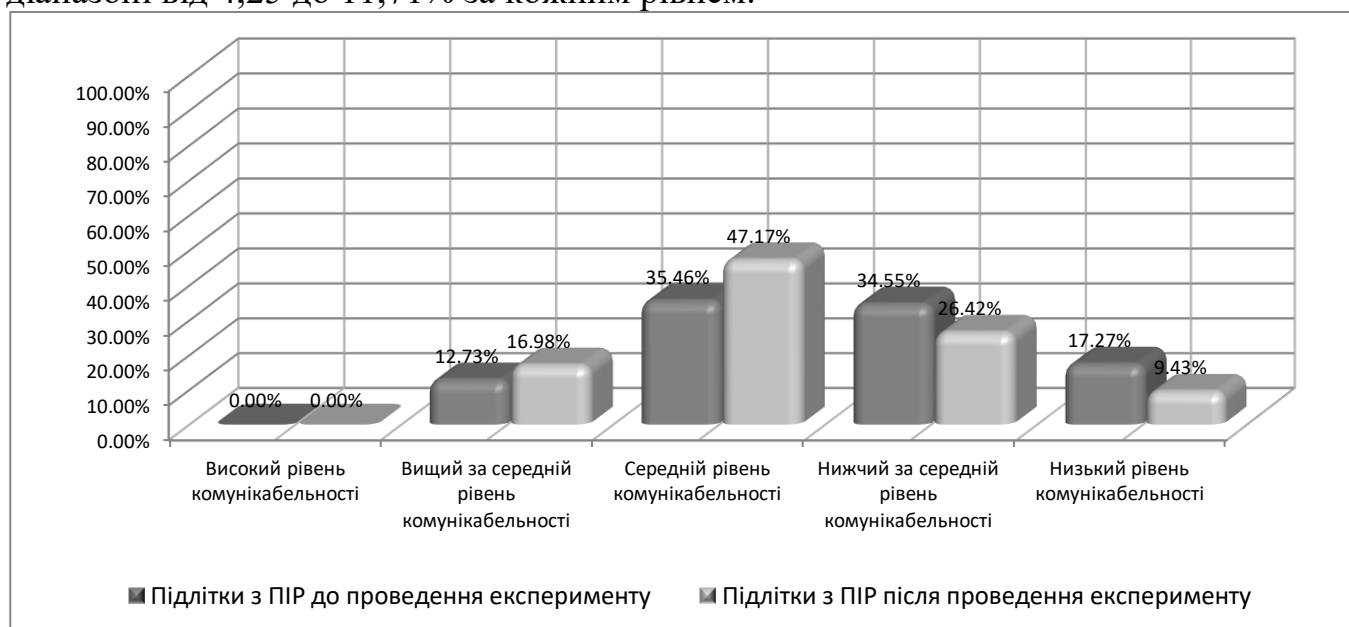
Рис. 3 Диференційний аналіз комунікабельності у дітей з ППР до і після проведення експерименту (у %)

З'ясовано позитивну динаміку змін комунікативних компетенцій школярів, що відображено за результатами оцінок формувального дослідження. Зокрема, визначено підвищення рівнів комунікабельності у дітей із ППР у діапазоні від 4,25 до 11,71% за кожним рівнем.