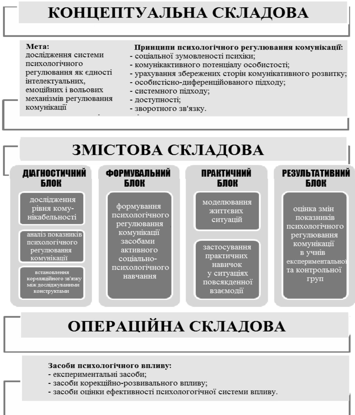
Рис. 2 Теоретична модель системи психологічного регулювання комунікації у підлітків з порушеннями інтелекту

«діти з порушеннями інтелектуального розвитку». Завданнями дослідження встановлено категорію осіб експериментального супроводу, які згідно Міжнародної класифікації хвороб (МКХ-10) мають порушення інтелектуального розвитку легкого ступеню (F70) різного генезу.