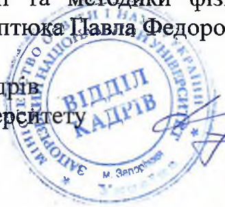
Драєвська Я. М.

Заступник начальника відділу кадрів Запорізького національного університету